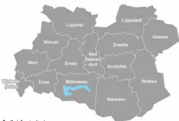
Der Kreis Soest mit seinen 14 Städten und Gemeinden

Grundlage der Fortschreibung ist eine ausführliche Bestandsaufnahme der abfallwirtschaftlichen Situation im Kreis Soest. Hierbei sind unter anderem Satzungen, Erfassungssysteme, Entsorgungswege und Informationsmaterialien analysiert und ausgewertet worden. Die mit jetzigem Stand des AWK dargestellten Abfallmengendaten stammen aus den Abfallbilanzen des Kreises Soest aus den Jahren 2013 bis 2022. Ergänzend werden geplante Maßnahmen im Rahmen der Abfallhierarchie erläutert.