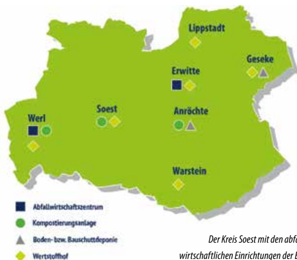
Der Kreis Soest mit den abfallwirtschaftlichen Einrichtungen der ESG